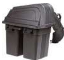
960 71 00-01 Uppsamlare Uppsamlare med stor volym (210 liter) med